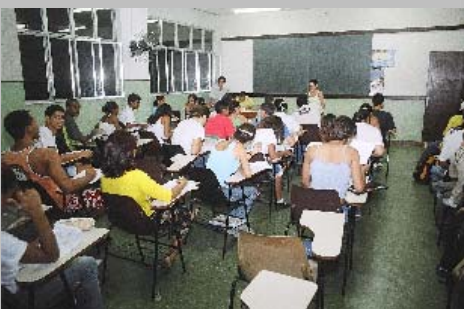
A Paróquia Cristo Redentor oferece aulas ministradas por professores voluntários